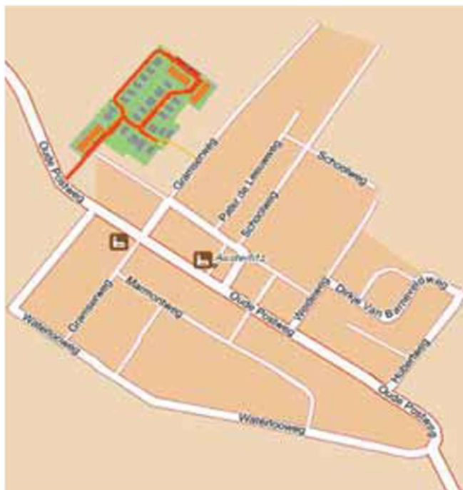
Ligging van het project in Austerlitz.