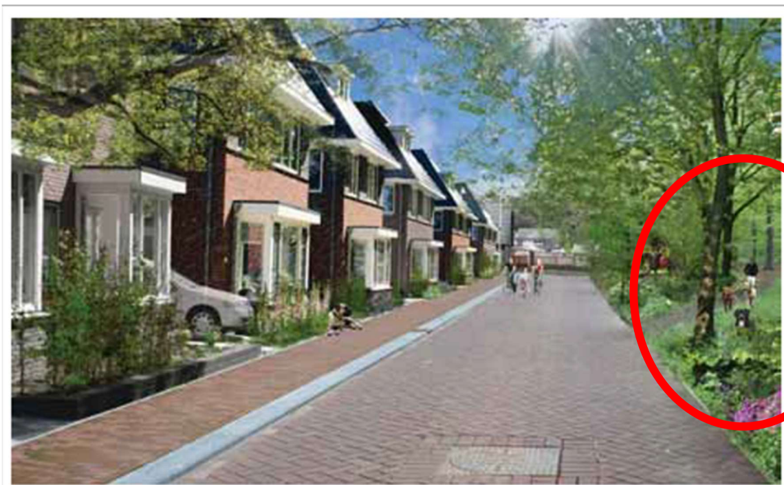
Zie hoe de wandelpaden uit het bos hier direct op de straat uitkomen.