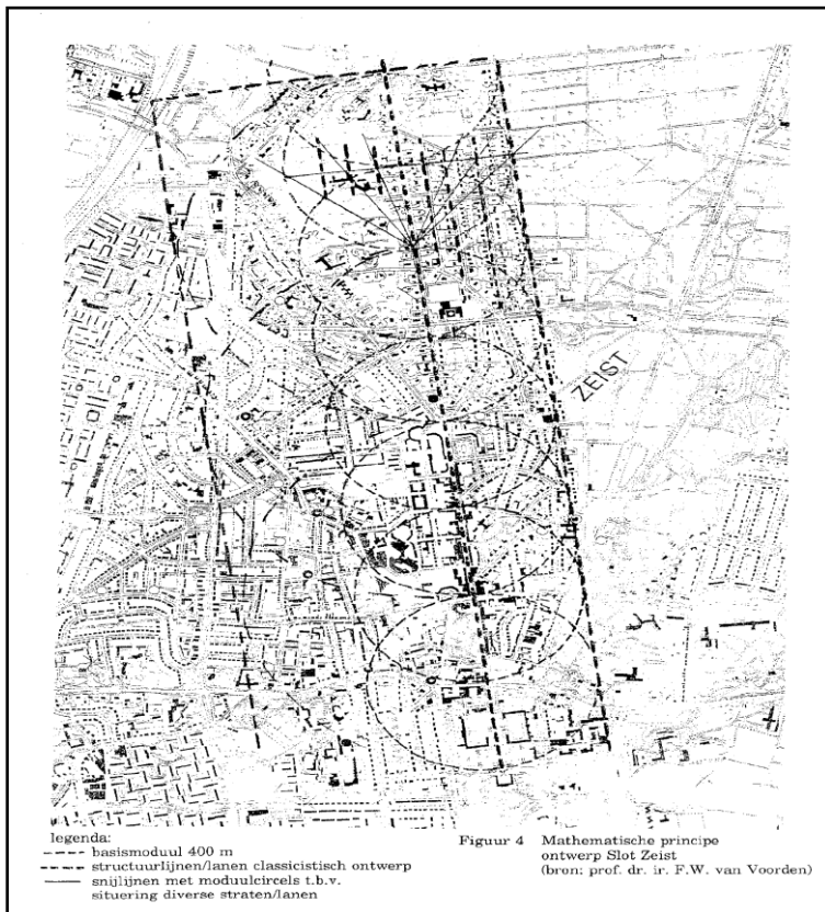
Landschappelijk ontwerp Slot Zeist 1680. Bron: Reconstructie door prof.dr.ir. F.W. van Voorden, TU Delft

Vraag: Zou er een aparte paragraaf (niet alleen onder Cultuurhistorie) opgenomen moeten worden die deze perfecte illustratie van bruisende en levende cultuurhistorie (van Zeist) verder uitwerkt in een sfeerbeeld, verder onderbouwt en ontwikkelingsrichting geeft?